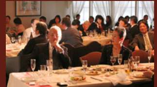
ディナーショー風景2