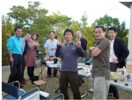
上司宅での有志バーベキュー

ガーデンシテイクラブ大阪（GCCO）は、コミュニケーションを深めるのに、いい組織だと思います。経営者同士が、会社という枠にとらわれず、ときには広く、ときには深く、自分が望めばいろいろな付き合いが可能になるでしょう。私のオフィスが同じビルの上層階なので、すぐに利用できるのも、嬉しいですね。最近では、ランチや歓送迎会などでお世話になる回数が増えていますので、もし見かけたらお声をかけてください。一緒に「飲みニケーション」ができれば嬉しいですね。