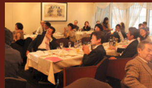
ディナーショー風景