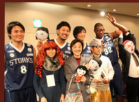
兵庫ストークスの選手と…

後半は今年結成された「GCCOバンド」の方々に演奏頂き、大いに盛り上がった大忘年会となりました。来年もぜひご参加くださいませ。