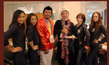
ストークガールズと…