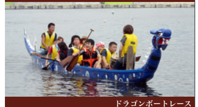
ドラゴンボートレース

GCCOのイベントにも関心をお持ちのようですので、どうぞご活用いただき、楽しんでいただけたらと思います。（編集子）