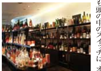
こだわりの希少な酒

「商品ではなく価値を売る」というコンセプトは、今や多くの企業が使っている。しかしホームページやチラシなど、全てのコンテンツにその理念を落とし込んでいる会社は少ない。なかなか、そこまで行き着くことができないのだ。梅酒屋は、その壁を乗り越えた稀有な会社の一つといえる。大胆な業態転換を行っても、結果はすぐには出ない。4年以上も「やせ我慢」を続けている間、不安にならなかつたのか、方法を変えようと思わなかつたのかと聞くところ、野球でも何でも、上手くなるためには地道なトレーニングで体と技を磨いていくしかありません。4、5年はむしろ予想よりも早い方でした」という返答。勝利のために実直に努力を重ね続けるスポーツ魂の大きさを、今回のインタビューで実感できた。YEAの副委員長としても、ぜひ皆さんを引っ張っていただきたい。編集子)