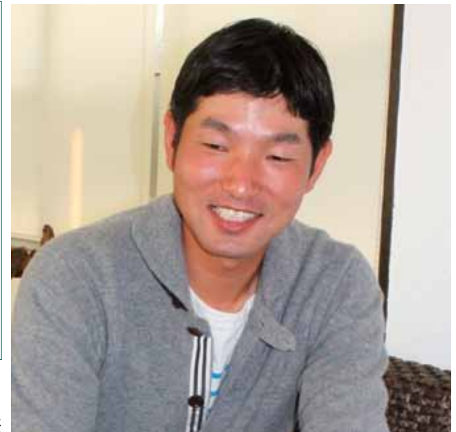
野球の戦略とプライダルの価値観で、赤字の酒屋を再建

私が子どものころから大学4年生まで、ずっとプロを目指して野球をしていました。大学を卒業した後、も企業の野球チームに入るつもりでしたが、景気が悪化して、企業のチームがほとんどリストラされていく時代になっていました。