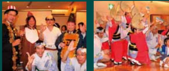
集合写真 阿波踊り「なにお連」

今年で4回目を迎えた、年末恒例の大忘年会。仮装大会も定着し、参加者の皆様は、思いの格好でお越し頂きました。会の宴の最後には、「なにお連」による阿波踊りを披露し、皆で阿波踊りを踊り、一年の締めくくりとなりました。